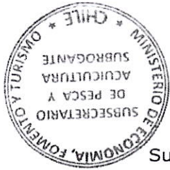
PAULO SEPÚLVEDA SEPÚLVEDA Subsecretario de Pesca y Acuicultura (S)

El texto íntegro del decreto se publicará en los sitios de dominio electrónico de la Subsecretaría de Pesca y Acuicultura y del Servicio Nacional de Pesca y Acuicultura.